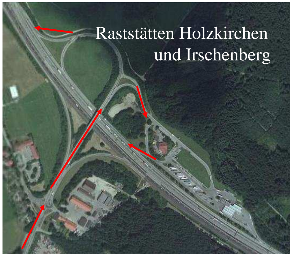
Raststätten Holzkirchen und Irschenberg

Die Option einer Erweiterung der Raststätte zur Anschlussstelle sollte hartnäckig verfolgt werden!